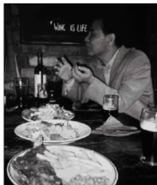
●ビール片手のPUB談義 手前にフィッシュ&チップス

ビール にポテトチップス、料理にたっぷりのバター、甘いジャム、シロップのたっぷりかかったデザート等、どれをとっても、「これじゃ〜、あの体型になるのも無理ないなあ」と思わされた。そんな栄養事情にも関わらず、健康に関してとても関心が強いことを研修の講義の中で聞いたり、書店にある栄養に関する書物の多さからも、与えられる情報が豊富であることを感じるが、どこの国でも同じで食生活を改善することの実践の難しさを痛感した。