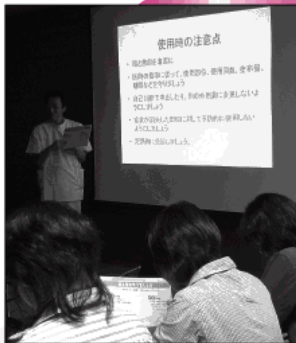
↑薬剤師からの話題提供