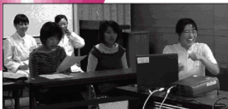
↑看護師からの話題提供