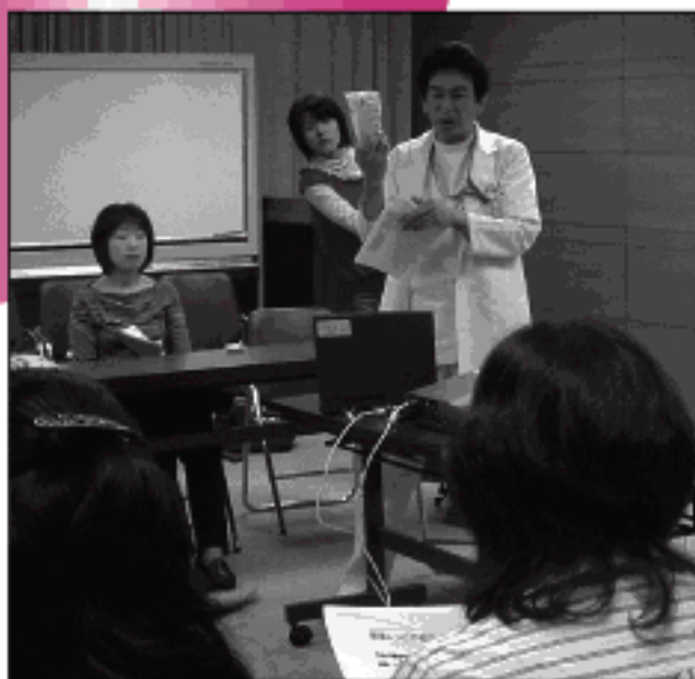
↑管理栄養士からの話題提供