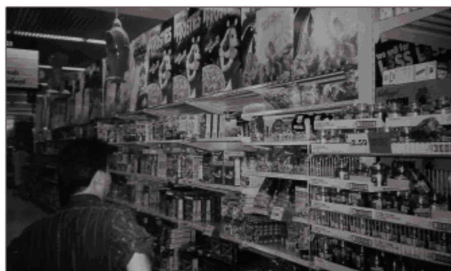
●スーパーマーケット店内風景