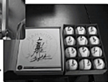
▶ 藤川投手がサインしてくれた多くのボールと色紙