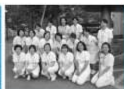
教育委員会の仲間たち