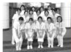
教育担当者会の仲間たち