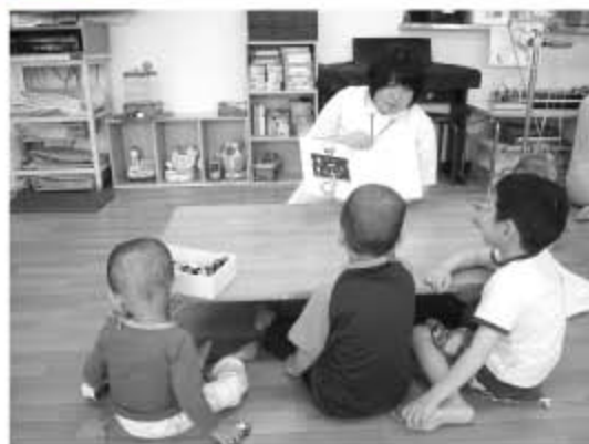
写真① 入院病棟での保育風景

習熟した看護スタッフおよび保育士を有する専用の入院病棟で、多くの科の先生達と協力し治療（化学療法・外科療法・放射線療法）を行います。子どもたちは長期間の入院を余儀なくされます。そのような子どもたちに専属の保育士による保育や、院内での学習により入院中の生活がより良いものとなるように心がけています（写真①）。