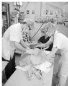
写真② 入院病棟での骨髄検査

・当科では診断・治療の一環として骨髄穿刺（マルク）・髄腔内注射（髄注）など痛みを伴う処置をしばしば行ないます。この処置の苦痛・不安を軽減するために、病棟にて麻酔科の全面的な協力の下、閉鎖循環式全身麻酔（セボフルレンを用いた吸入麻酔）による疼痛管理を積極的に実施しています（写真②）。