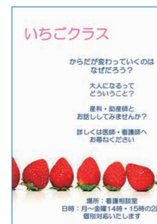
いちごクラスのポスター

「いちごクラス」の話を聞いてみたいと思われるなら、ぜひ外来看護師または主治医へ声をかけてください。私たちと一緒にステキな大人への階段を上っていきましょう！